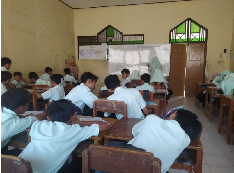
Gambar 1. Proses pembelajaran