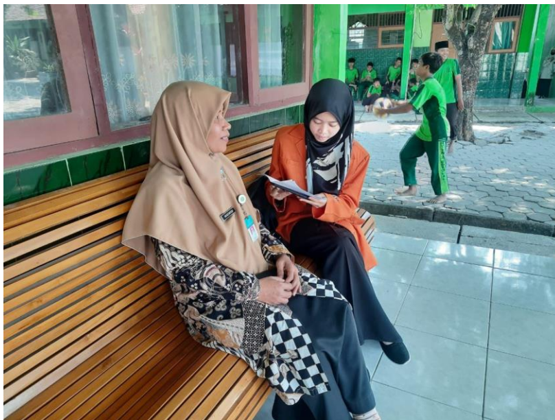
Gambar 2. Wawancara dengan guru bahasa Arab