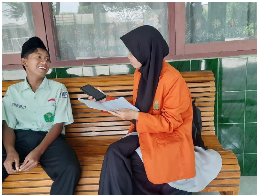
Gambar 4. Wawancara dengan siswa