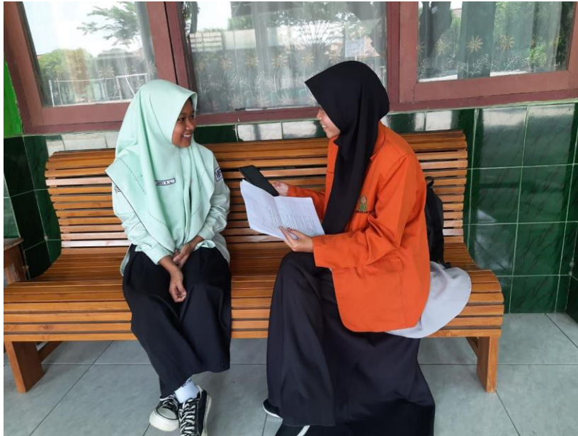
Gambar 3. Wawancara dengan siswa