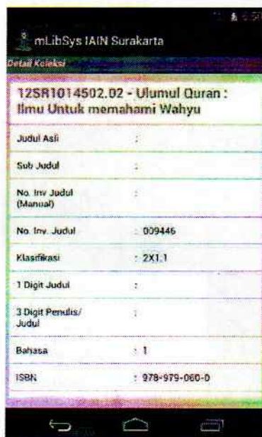
Gambar 8. Informasi Detail Koleksi Buku