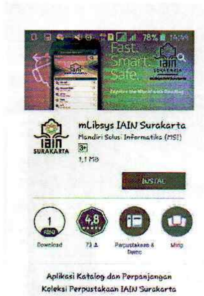
Gambar 2. Tampilan Utama mLibSys IAIN Surakarta di Google Play Store

Setelah masuk di Google Play Store, maka pilih mLibSys IAIN Surakarta untuk diinstal. Seperti tampak pada gambar dibawah ini :