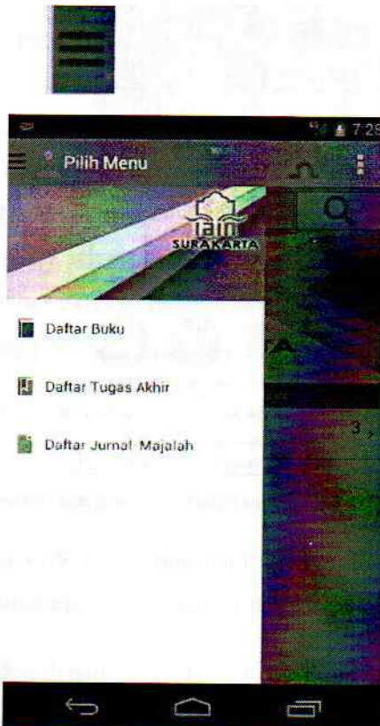
Gambar 4. Tanda untuk melihat menu pada mLibSys IAIN Surakarta

Untuk melihat menu seperti daftar koleksi silahkan mengklik tanda pada pojok kiri dan akan muncul tampilan berikut ini :