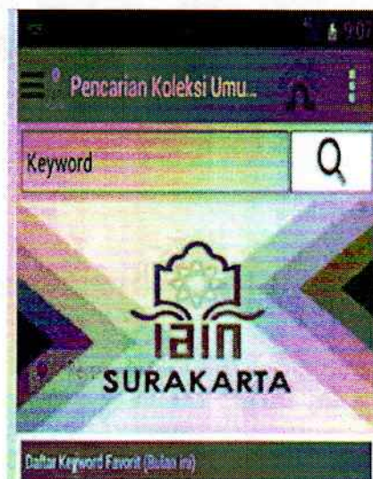
Gambar 3. Menu Tampilan Utama mLibSys IAIN Surakarta

Setelah download akan muncul tampilan utama mLibSys IAIN Surakarta, pemustaka dapat langsung melakukan pencarian koleksi dengan memasukkan kata kunci ( keyword ) seperti terlihat pada tampilan berikut ini :