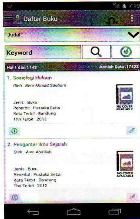
Gambar 6. Menu Daftar Koleksi Buku

Untuk melihat informasi detail koleksi dengan mengklik Tombol Bulat pada Menu Daftar Koleksi Buku, maka akan muncul tampilan Informasi Detail Koleksi Buku