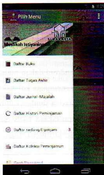
Gambar 11. Tampilan Menu Anggota setelah berhasil login

Jika pemustaka mengetik username dan password dengan benar, maka akan muncul tampilan menu berikut ini :