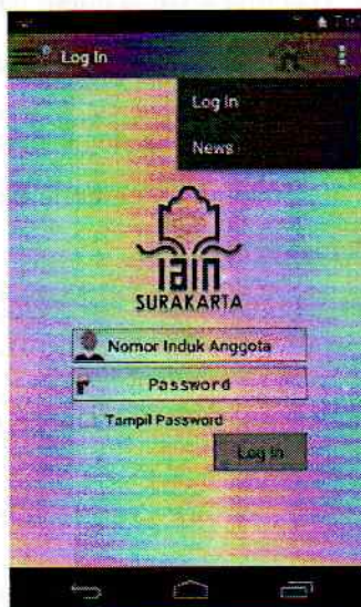
Gambar 10. Menu Login Anggota Perpustakaan

Setelah login member diklik maka akan muncul tampilan berikut ini :