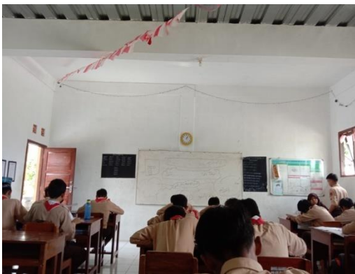
Gambar ٣. Pembelajaran Maharoh Qiroah