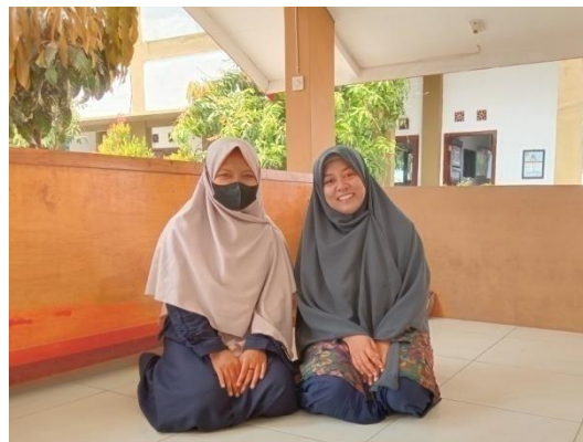
Gambar ٤. Wawancara dengan guru bahasa arab