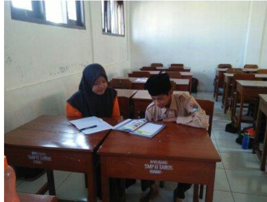
Gambar ٢. Merekam Bacaan Siswa