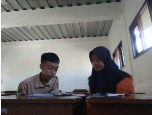
Gambar ١. Wawancara dengan Siswa