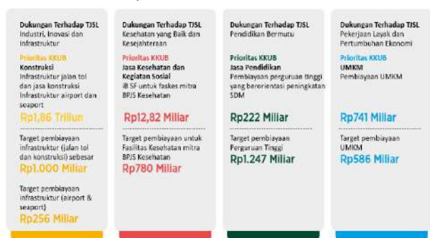
Gambar 4.8 Pelaksanaan Tanggung Jawab Sosial dan Lingkungan (TJSL) Mandiri Syariah Tahun 2020

Di tahun 2021, BRI Syariah, Bank Syariah Mandiri dan BNI Syariah berhasil menyelesaikan proses penggabungan bank menjadi Bank Syariah Indonesia (BSI). Selain itu, mereka menetapkan portfolio Usaha Mikro, Kecil, dan Menengah (UMKM) serta Green Financing sebagai program-program prioritas. BSI juga mengupayakan klasifikasi terhadap debitur yang memiliki Peringkat Kinerja bagus selama tahun 2021, tujuh perusahaan telah berhasil meraih Penghargaan PROPER (Perusahaan dalam Pengelolaan Lingkungan Hidup) kategori Biru. Bank Syariah Indonesia telah mengeluarkan dana pembiayaan sebesar Rp171.291 triliun kepada pelaku usaha, mencapai 102,65% dari target yang ditetapkan pada tahun 2021. Berikut adalah Portofolio Pembiayaan selama tahun 2021.