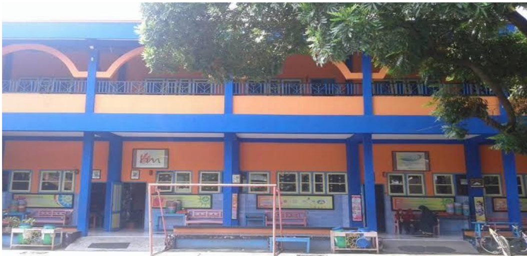
Depan MI Muhammadiyah PK Kartasura