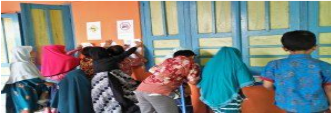
Pembelajaran Bahasa Arab di luar kelas