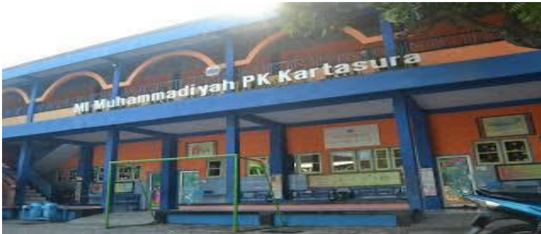
Gedung MI Muhammadiyah PK Kartasura