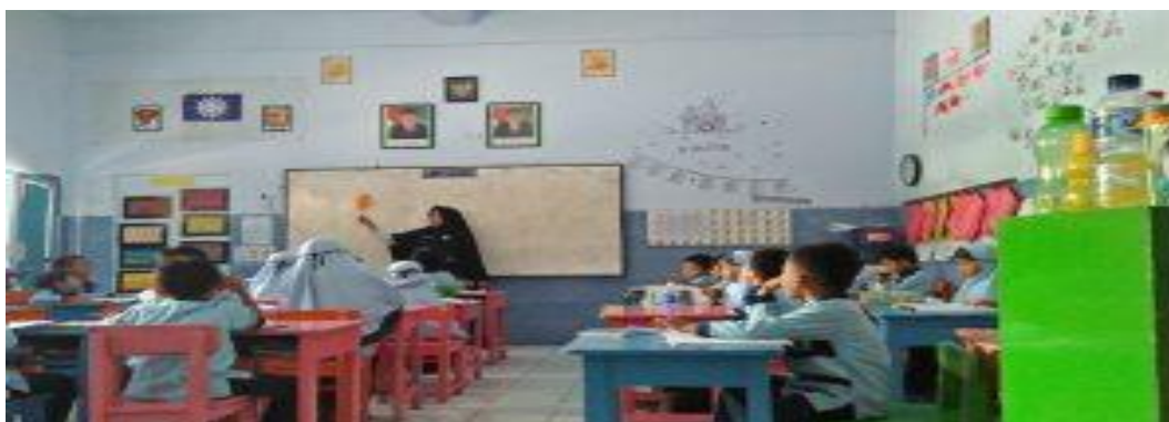
Pembelajaran Bahasa Arab di Kelas