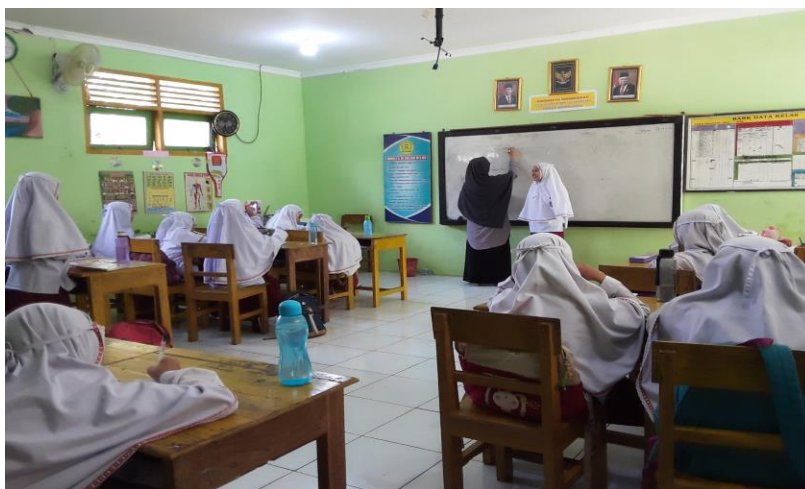
Observasi Pembelajaran di Kelas 5