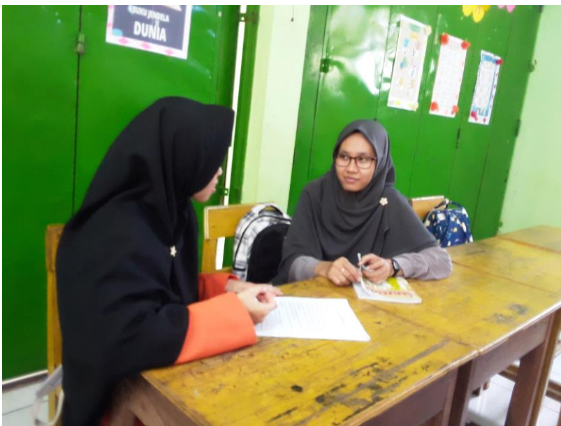
Wawancara dengan Bu Gita