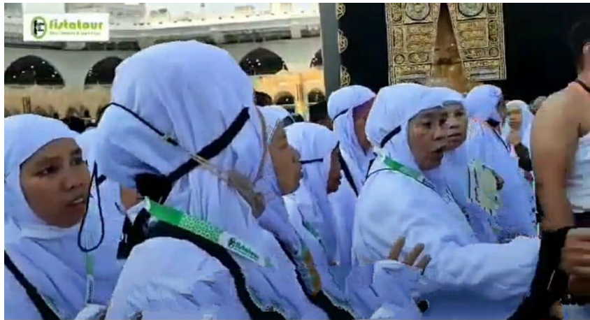
Gambar 4. 2 Kegiatan Tawaf