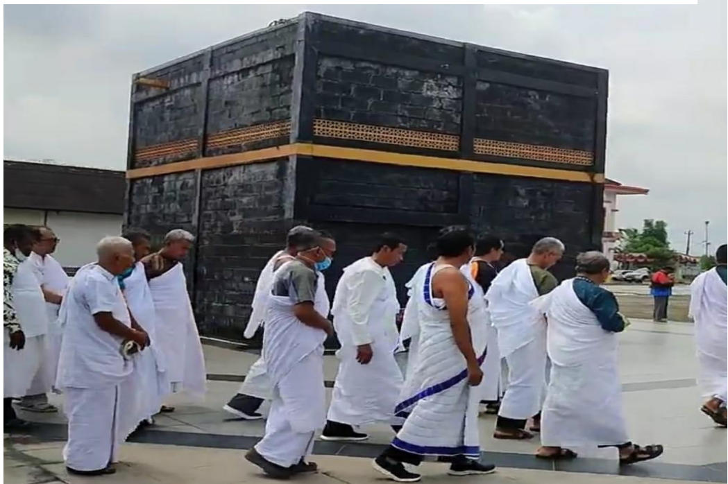
Gambar 4. 1 Kegiatan Manasik Praktik