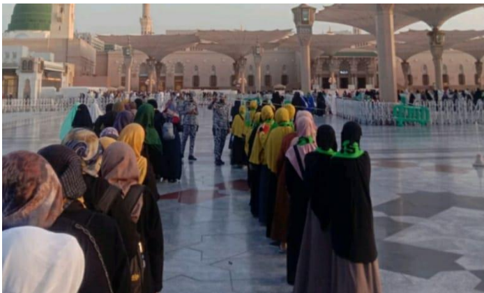
Doc. Bimbingan jemaah di Kota Madinnah