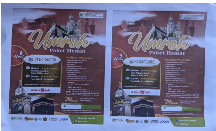
brosur paket umrah di Biro Fista Tour