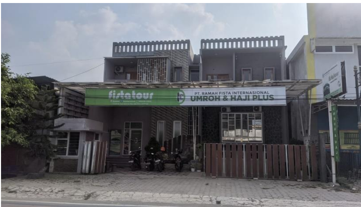
lokasi penelitian, Biro Fista Tour Klaten