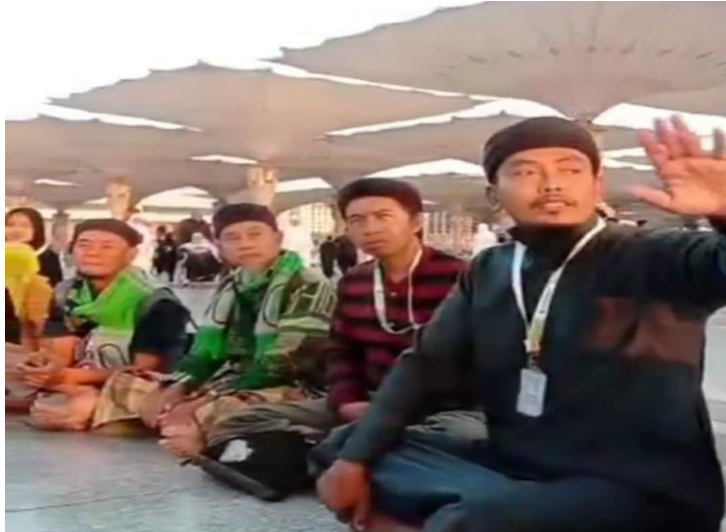
Gambar 4. 3 Kajian Tematik