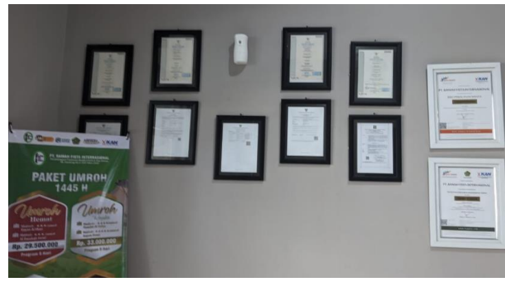
Sertifikasi Biro Fista Tour