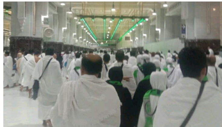
Doc. Bimbingan jemaah saat kegiatan sa'i di Kota Makkah