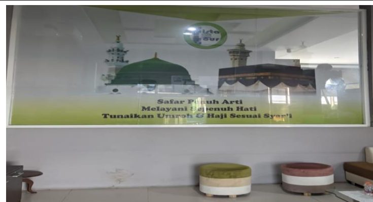
Lokasi Bimbingan Manasik Umrah di Kantor Biro Fista Tour