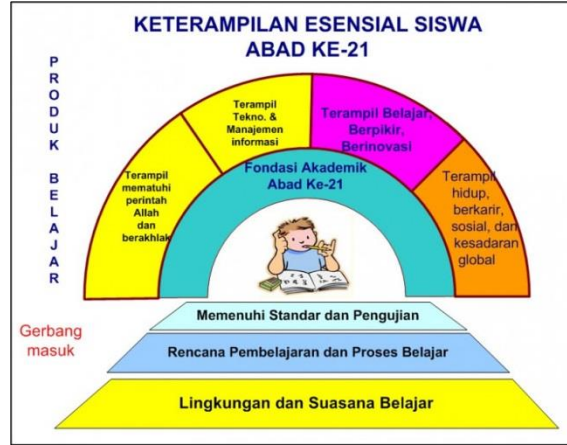
Gambar ١ Pelangi Keterampilan Abad ٢١

المهارات الحياتية والمهنية ، والتي تشمل مهارات العيش في العالم ، والمبادرة والقدرة على التنظيم الذاتي ، والتفاعل الاجتماعي والثقافي ، والمساءلة والإنتاجية ، والقيادة والمسؤولية كما هو موضح في إطار كفاءات التعليم للقرن الحادي والعشرين على النحو التالي :