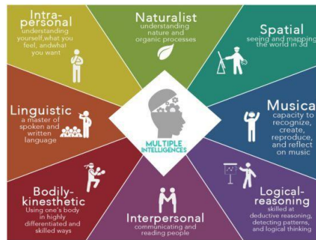
Gambar ٢ Multiple Intelligences

في المصطلحات ، يُعرّف الذكاء بأنه طبيعة تفكير الشخص التي تشمل القدرات ، سواء القدرة على التفكير وحل المشكلات والتخطيط والتفكير المجرد واللغة والأفكار وتلقي الدروس (Hanani, ٢٠٢٠, hal. ١٢٣) لذلك ، فإن الذكاء مرادف للقدرة المعرفية للفرد. في الكلمات الإنجليزية عديديعني العديد ، ومضاعفات. بينما قال الذكاءات تعني المعرفة أو الذكاء. لذا اقترب العديد الذكاءاتيعني امتلاك قدر كبير من الذكاء أو يمكن قوله بذكاءات متعددة. حيث يتم في هذا المدخل استخدام جميع الجوانب لتعليم اللغة العربية بدءاً من الجوانب المعرفية والجوانب الحركية والنواح يتربوي تستخدم أيضاً. وفقا لغاردنر في الذكاءات المتعددة ( Multiple Intelligences ) تنقسم إلى ثماني ذكاء يتم اختصارها SLIM N BIL (Shodiq, ٢٠١٨) غالباً على النحو التالي :