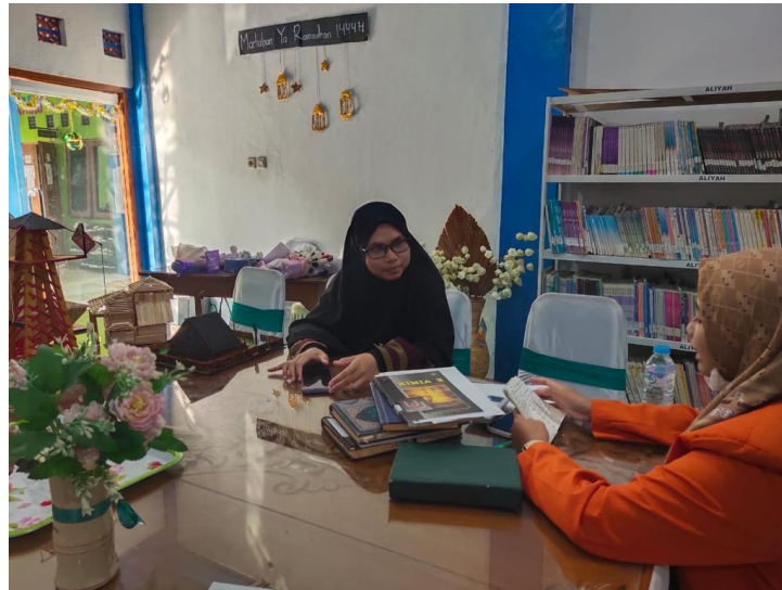
Wawancara ustadzah ketua pengasuhan