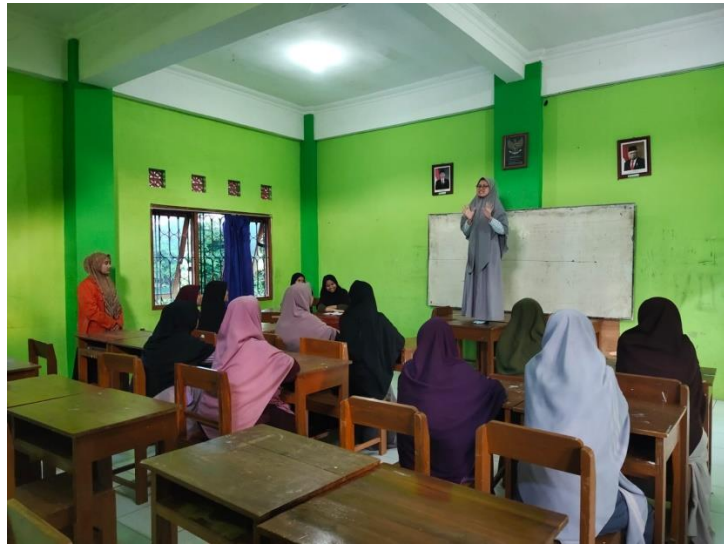
Pengamatan pelaksanaan Kegiatan Muhadhoroh