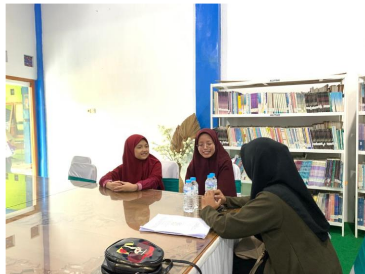
Wawancara Ustadzah bagian bahasa