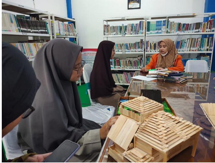
Wawancara santriwati kelas 12