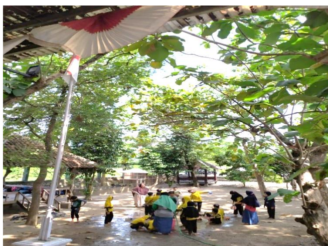
Dok: Foto kegiatan pembelajaran di SAA: guru sedang memberikan pembelajaran leadership dan mental sosial melalui kegiatan games dengan menggunakan air dan bermain lumpur

untuk kurikulum lokal kami buat sendiri dengan melihat potensi sekolah, anak dan orangtua. Karena ini berbasis alam maka kurikulum yang diterapkan berbasis realitas sosial. Maksudnya pembelajaran dengan mengedepankan kebutuhan sosial sesuai dengan usianya. Mereka bisa belajar di alam bersama dengan temannya seperti belajar kepemimpinan dan kerjasama. Belajar disesuaikan dengan keinginan dan perkembangan psikologisnya seperti bermain air, bermain lumpur dan seterusnya sehingga ditengah pembelajaran itulah sikap dan mental sosial mereka ditanamkan.