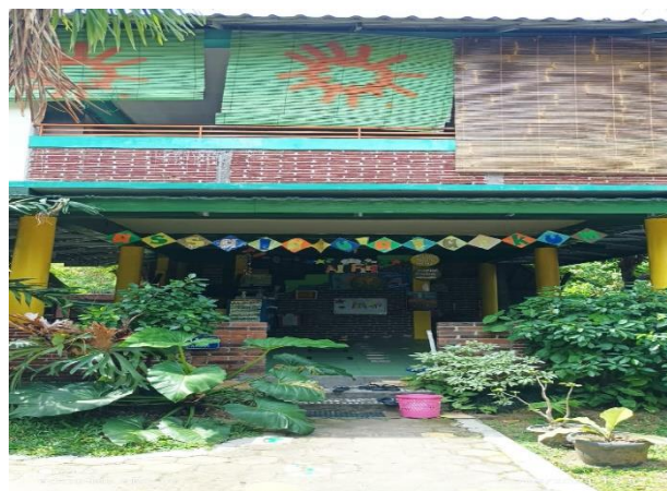
Gb. Dokumentasi beberapa ruang kelas