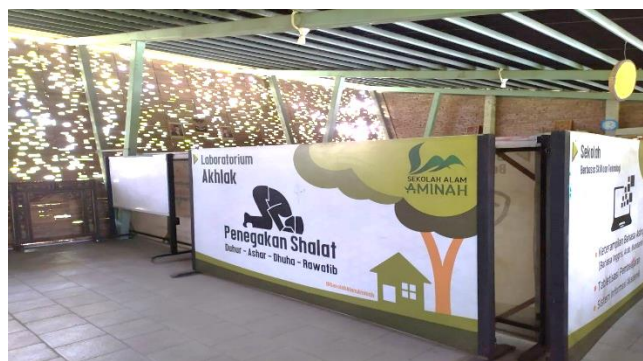
Dok: Foto, Laboratorium akhlak (tempat ini digunakan untuk mendidik dan membina akhlak siswa)

Pendidikan agama lebih dominan bagi mereka karena ada integrasi antara materi yang diajarkan dengan nilai-nilai Islam. Hal ini juga terlihat dari adanya laboratorium Akhlak, dimana para siswa dibina akhlaknya menjadi akhlak yang karimah. Mereka diajarkan akhlak kepada Allah SWT dengan menjalankan ibadah, akhlak kepada sesama dengan saling menghormati dan menghargai serta saling membantu, akhlak kepada alam yaitu menjaga alam dengan baik, dan akhlak kepada orangtua juga menjadi yang diutamakan.