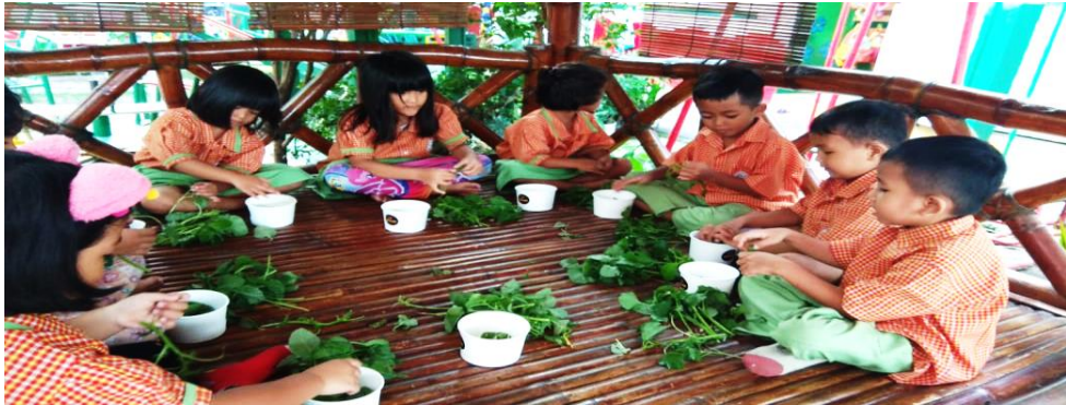
Gambar 5: Kegiatan outdoor memeras bayam