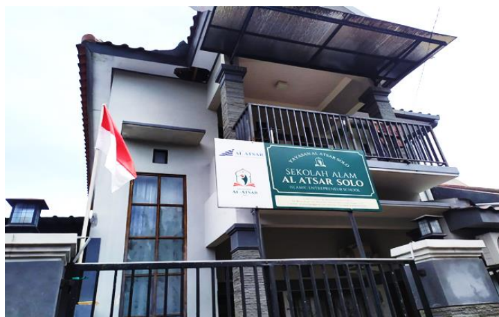
Dok: foto Sekolah Alam Al Atsar dengan Bendera merah putih di sampingnya

Kegiatan pembelajaran dilakukan secara humanis dengan pendekatan psikologis, wawasan kewirausahaan keagamaan dan kebangsaan dikembangkan dalam pola pembelajaran. Sehingga dalam hal ini sekolah SAA bersifat moderat.