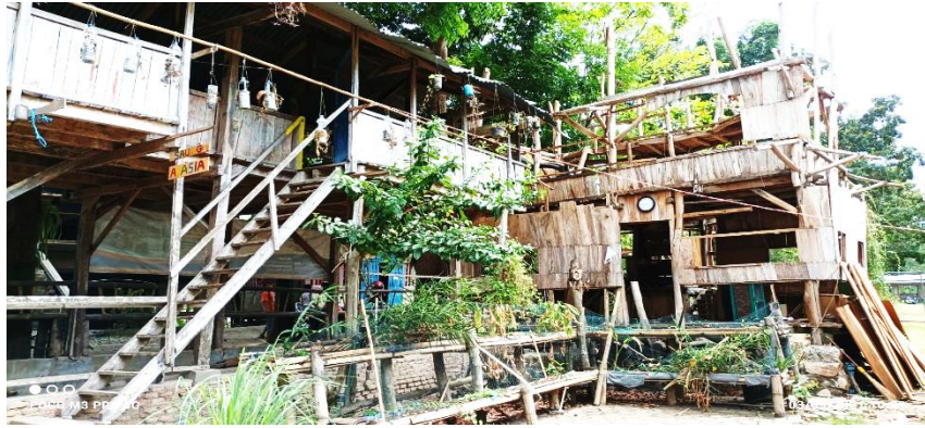
Gb. Dokumentasi nampak bangunan bangunan berupa Saung-Saung asli terbuat dari kayu