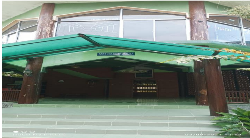
Gb. Dokumentasi masjid yang letaknya tepat garis lurus dengan pintu masuk Sekolah Alam Muhammadiyah Surya Mentari.letaknya memiliki filosofi ketika anak baru datang kesekolah anak langsung menuju masjid.