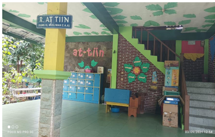
Gb. Dokumentasi salah satu model ruang kelas Sekolah Alam Muhammadiyah Surya Mentari

Selain itu, agar anak tidak merasa bosan maka setiap kegiatan tidak selalu di dalam kelas. Akan tetapi terbiasa berpindah pindah tempat ( moving tetapi tercontrol ). Memang ada kegiatan-kegiatan yang berlangsung di kelas, akan tetapi tidak sepenuhnya dalam waktu sehari selalu di dalam ruang kelas. Yang jelas, Sekolah Alam Muhammadiyah Surya Mentari tetap mengajarkan pembiasaan sikap antri, memungut sampah, merapikan sesuatu yang berantakan, sikap santun, jujur dll. Sehingga anak bebas menunjukkan ekspresinya ketika di sekolah.