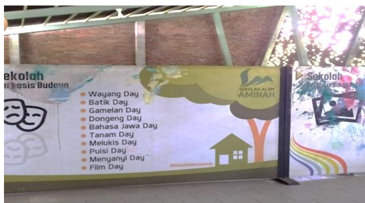
Dok: foto kegiatan sekolah berbasis budaya lokal

Budaya lokal dijadikan alat untuk mengembangkan potensi anak dan pengembangan akhlak.