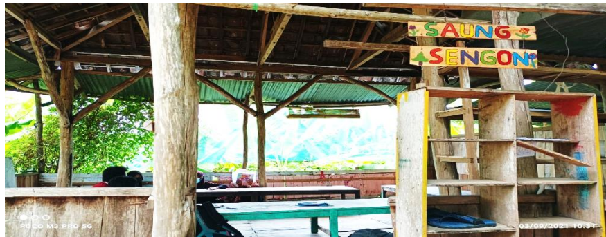
Gb. Saung sengon yang menjadi salah satu model tempat belajar sebagai bentuk Kearifan Lokal