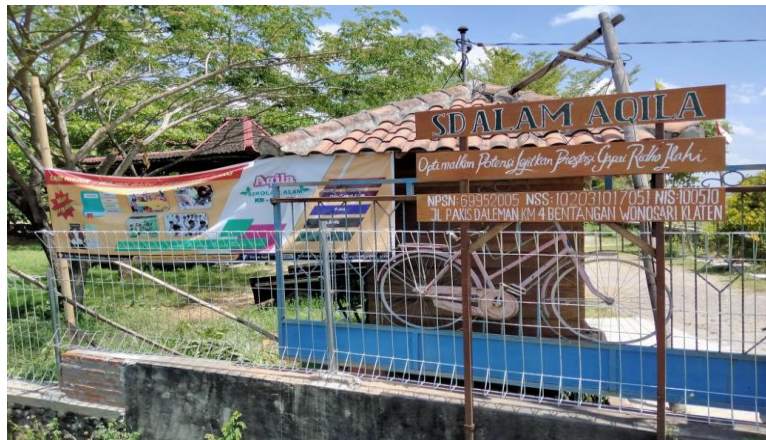
Gambar : Gerbang Sekolah Alam Aqila