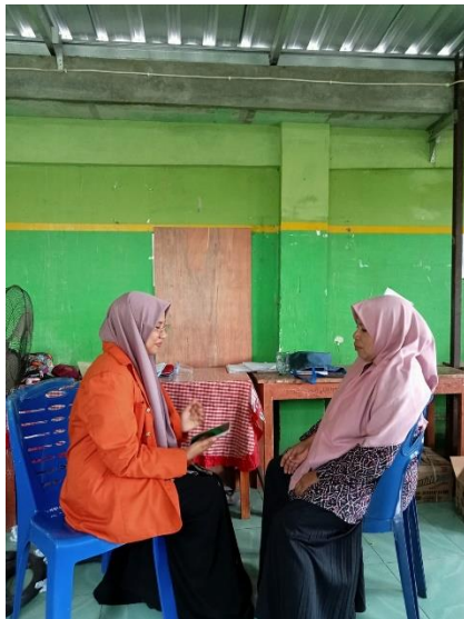
Dokumentasi wawancara guru mapel Bahasa Arab