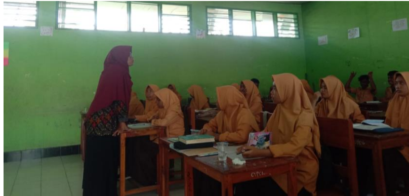
Suasana belajar di kelas