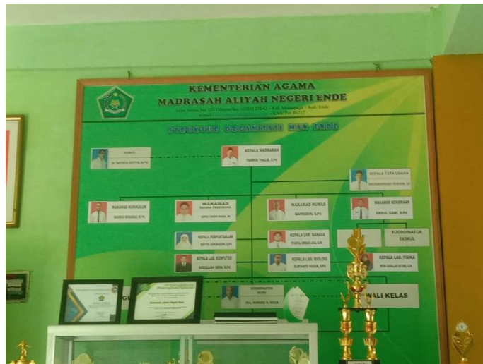
Dokumentasi papan struktur organisasi MAN Ende