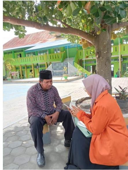
Dokumentasi wawancara Wakamad Kesiswaan