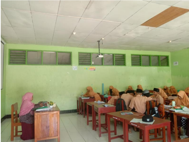
Suasana belajar di kelas X Keagmaan