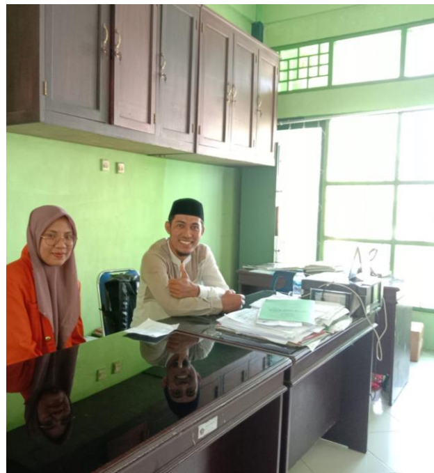
Dokumentasi wawancara Wakamad Kurikulum