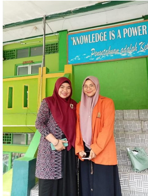
Dokumentasi wali kelas X Keagamaan