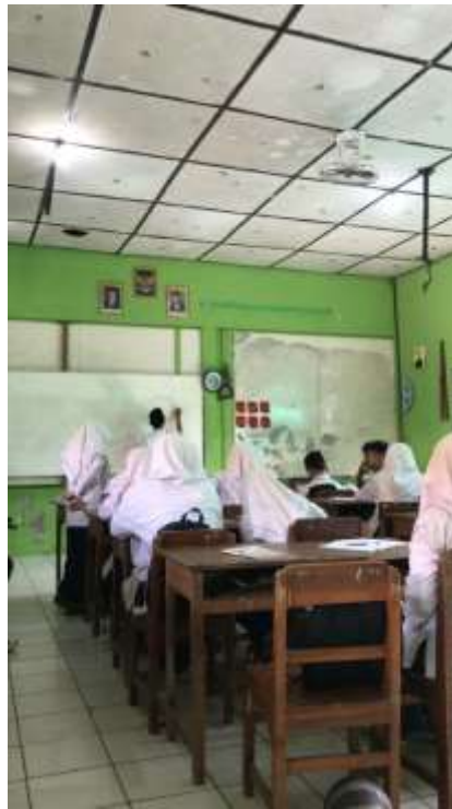
Gambar 2. Proses kegiatan pembelajaran kelas 9E