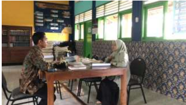
Gambar 1. Wawancara dengan guru bahasa Arab