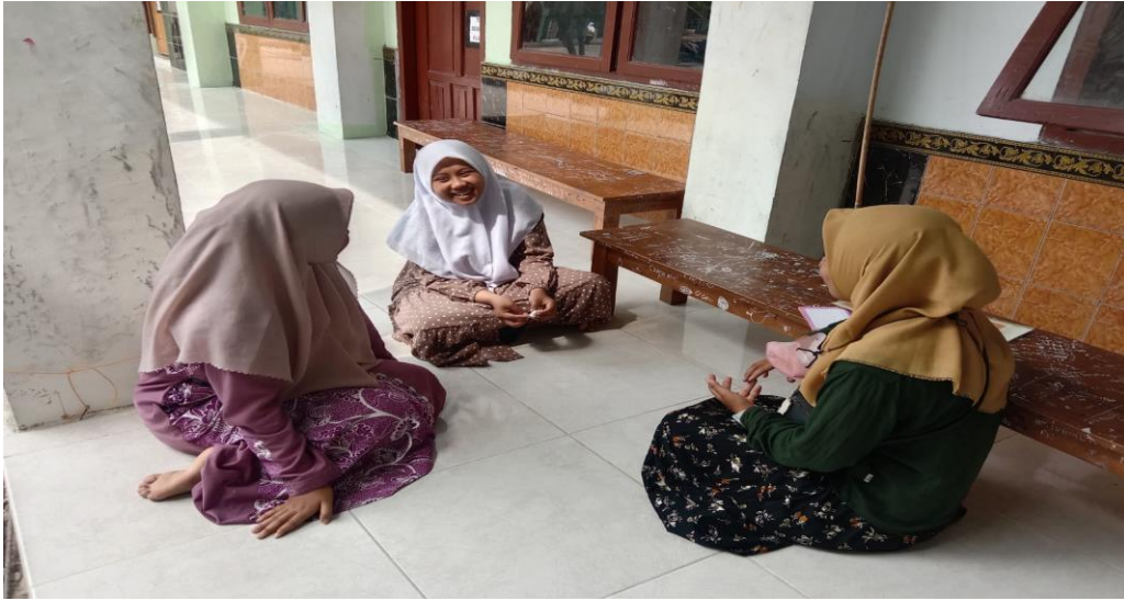
Wawancara dengan seksi bahasa