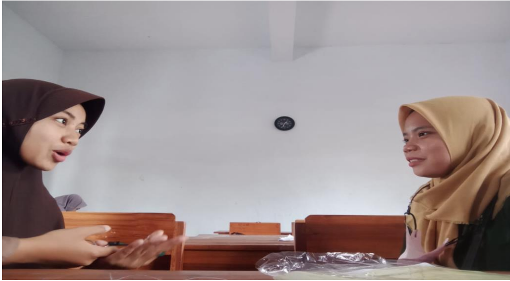
Wawancara dengan ustazah bagian bahasa (LAC)