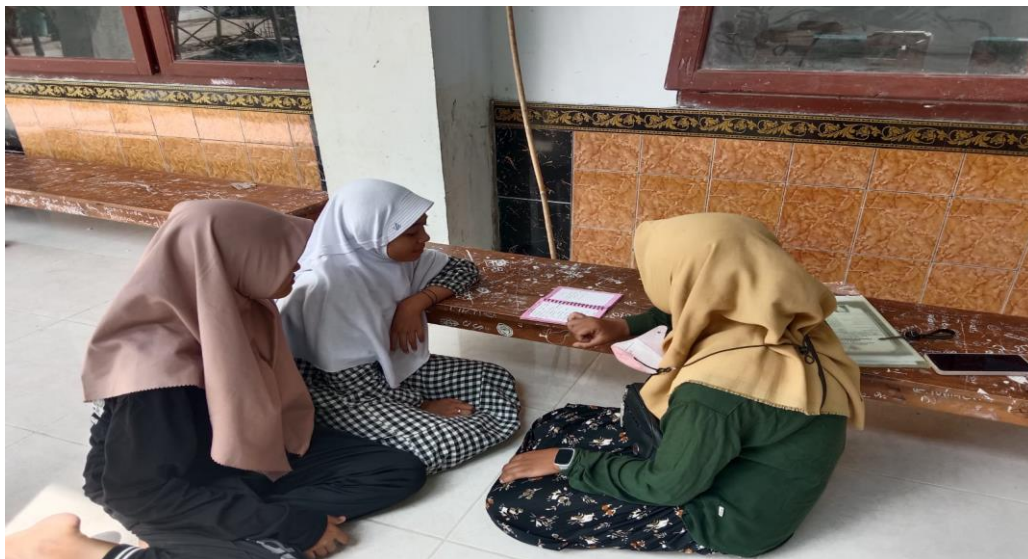
Wawancara dengan santri