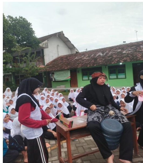
Pelaksanaan role playing