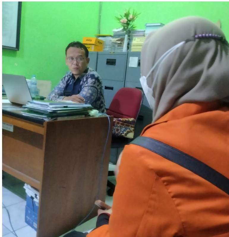
Wawancara dengan Waka Kurikulum MTs N Surakarta I