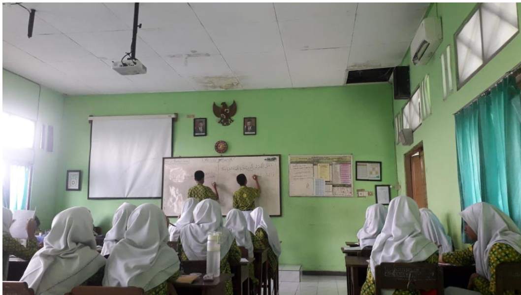
Pembelajaran Bahasa Arab kelas 9 FD 3 MTs N Surakarta I