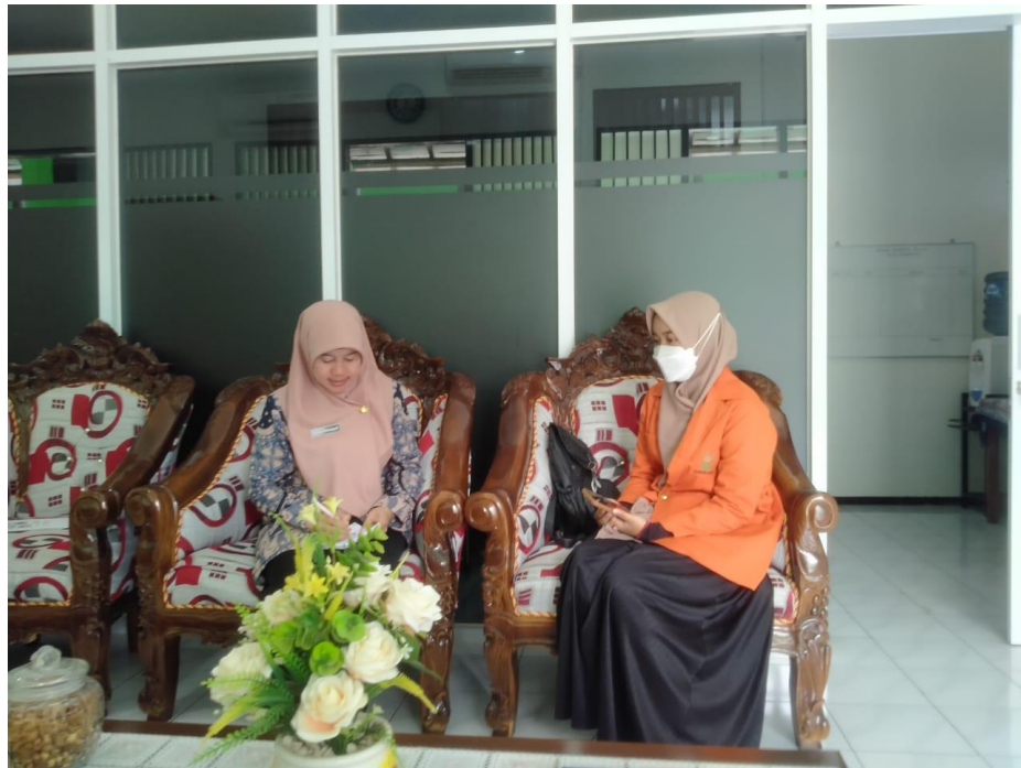
Wawancara dengan Kepala MTs N Surakarta I