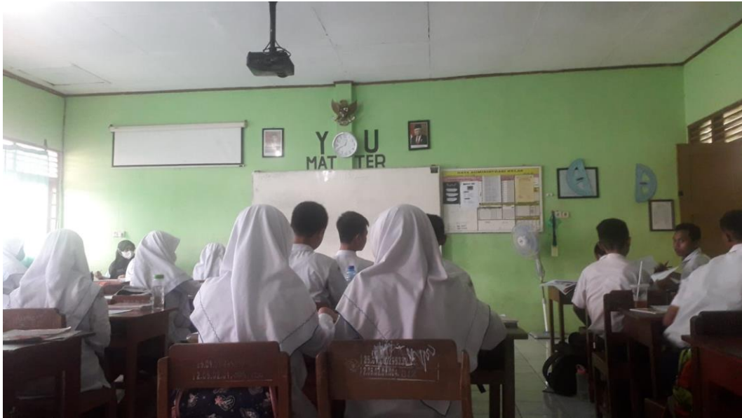
Pembelajaran Bahasa Arab kelas 8A MTs N Surakarta I