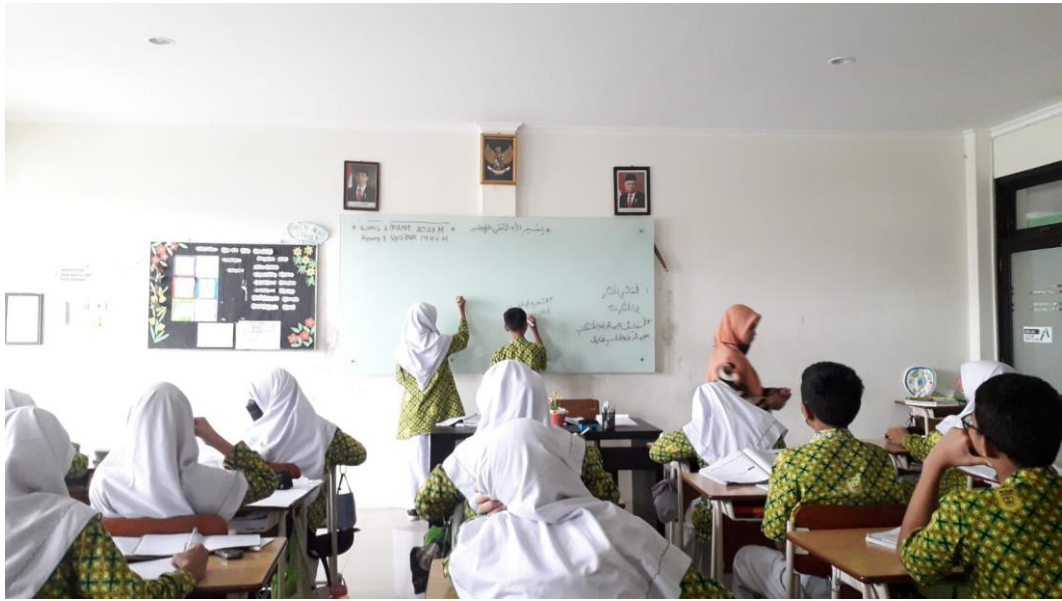
Pembelajaran Bahasa Arab kelas 7 Sains 3 MTs N Surakarta I