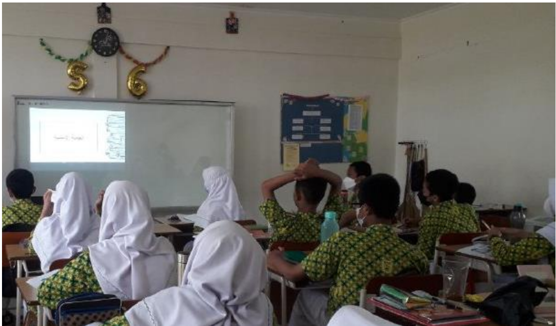
Pembelajaran Bahasa Arab kelas 8D MTs N Surakarta I