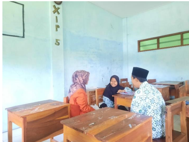
(Wawancara dengan Siswa Kelas 10 IPS 5)