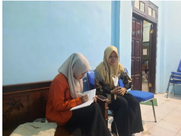
(Wawancara dengan Guru Bahasa Arab Kelas 10)