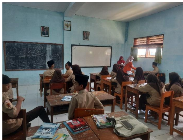
(Kondisi Saat Membagikan Angket di Kelas 10 IPS 5)