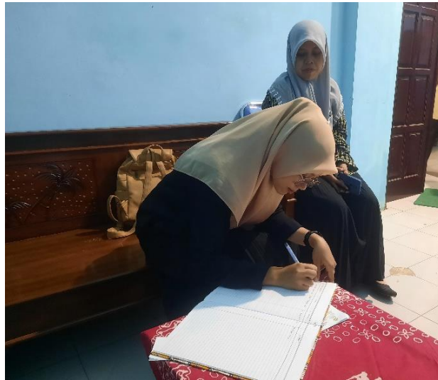
(Memasukkan Surat Izin Penelitian)