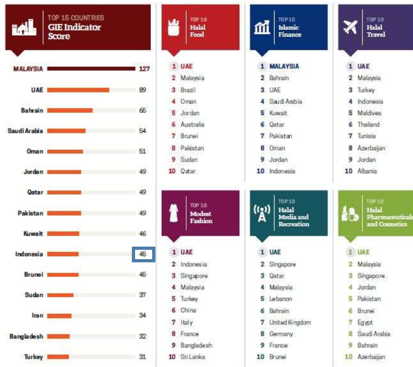
Gambar 1. GIES 2018