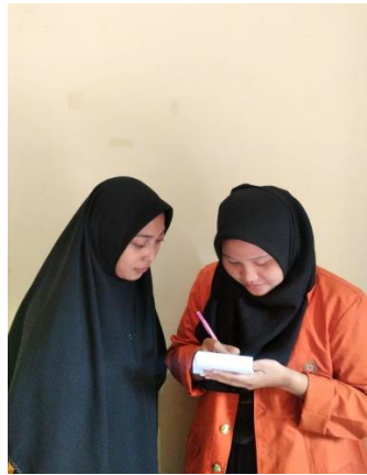
Gambar 7. Wawancara Koor. Program Bahasa