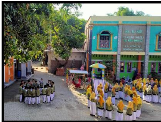
Gambar 3. proses setoran hafalan kosa kata