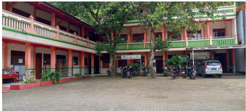
Gambar 6. Kondisi Madrasah