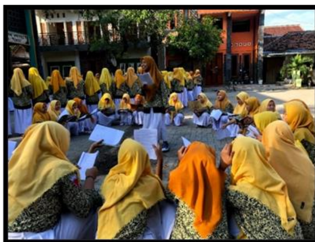
Gambar 4. Proses murojaah kosa kata yang telah diberikan