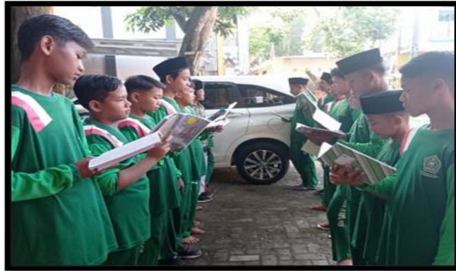
Gambar 2. proses menghafal kosa kata yang telah diberikan