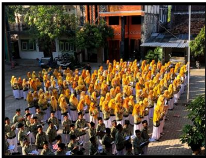
Gambar 1. Proses pemberian kosa kata oleh kepala sekolah

Kegiatan tersebut dilakukan seperti biasanya dengan dibuka oleh kepala sekolah dan penyampaian kosakata seperti halnya observasi yang sebelumnya. Observasi kali ini saya menjumpai siswa yang tidak mendengarkan apa yang disampaikan kepala sekolah mereka malah asik ngobrol dengan temannya, kemudian ditegur oleh guru pembimbing. dari situ saya tertarik untuk bertanya apakah alasan mereka tidak mendengarkan kepala sekolah dalam menyampaikan kosakata, ternyata jawaban dari siswa tersebut adalah karena mereka bosan dengan metode penyampaian yang begitu-begitu saja.