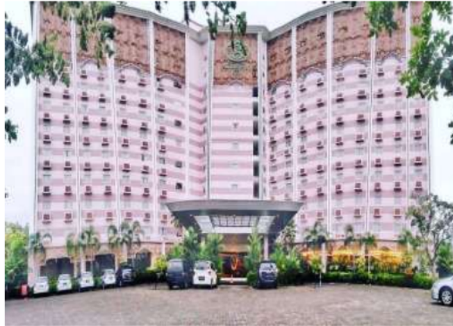
Gambar1. Syariah Hotel Solo

Syariah Hotel Solo mulai diresmikan pada 11 Maret 2014 di kota Solo. Hotel ini berdiri di bawah pimpinan Hotel Anom Solo Saranatama Group (HAS) (Solo, 2021).