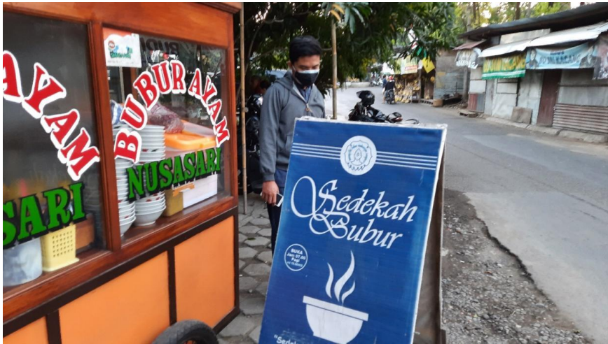
Gambar 2: Lembaga Akademik di belakang Café Librairie

Masih menurut Sutanto, yang terjadi sekarang ini adalah persoalan kehidupan ini hadir dimasukkan ke dalam laboratorium, kemudian dibawa ke sekolah, lalu diselesaikan dengan simulasi-simulasinya. Nah yang menjadi trend berikutnya adalah bahwa berpikir simulasi-simulasi ini tidak lengkap, dan semakin jauh dari momen problem yang semakin kompleks. Saat ini ada jarak yang luar biasa antara kampus dengan ilmu yang dikembangkannya dengan kenyataan hidup masyarakat. Kampus jalan sendiri dengan ilmunya yang tidak bisa diakses oleh masyarakat. Sutanto menyatakan,