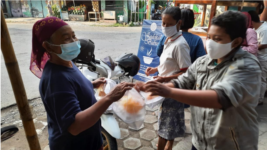
Gambar 5: Manfaat Bubur Sedekah bagi Masyarakat Dhuafa

lebih banyak kepada pemberi sedekah. Pemberian tersebut tentu tidak harus bersifat material. Rasa puas, karena sedekahnya aman dari kecurangan, rasa puas telah merasa membantu sesama, dan rasa puas menghidupkan pedagang kecil untuk tetap survive adalah serangkaian hal yang bisa diberikan oleh agen penerima sedekah.