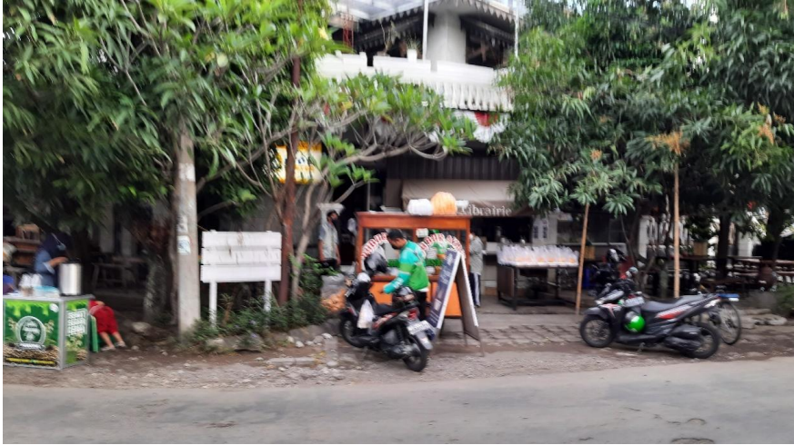
Gambar 3 : Bubur Sedekah di Tengah Lesunya Pasar

oleh hampir semua pedagang Pasar Legi, tidak terkecuali Bubur Sedekah.