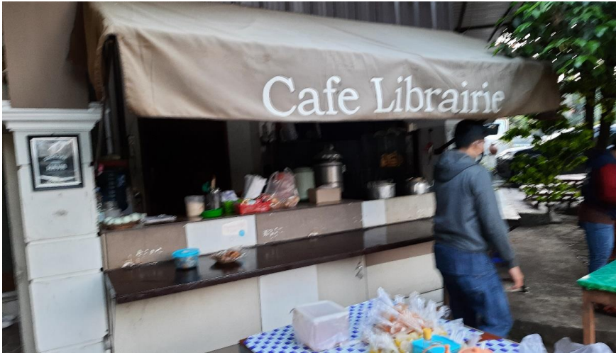
Gambar 1 : Sisi Depan Café Librairie