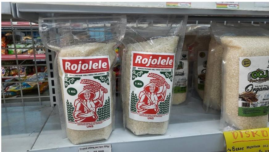
Gambar 6: Efek Domino Bubur Sedekah Menggerakkan Petani Rojo Lele

Melalui bubur sedekah, manfaat itu bersifat multi effect . Dengan bubur sedekah, pihak yang bermanfaat bukan hanya satu pihak (penerima sedekah), tetapi juga pedagang bubur, dan juga petani penyuplai beras untuk bahan bubur, yang sementara dalam kesulitan pemasaran hasil pertanian mereka (Wawancara dengan Bapak Lilik Setiawan dan Ibu Diana).