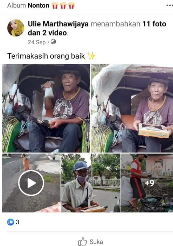
Gambar 7: Peran IT ( Information Technology ) dalam Konsep Bubur Sedekah

Pada beberapa tahun sebelum pandemi, antusiasme pelanggan untuk bersedekah masih tinggi. Banyak pelanggan yang di samping membeli bubur untuk dimakan sendiri, mereka juga membeli bubur untuk disedekahkan, (Wawancara dengan Bagus dan Gilang).