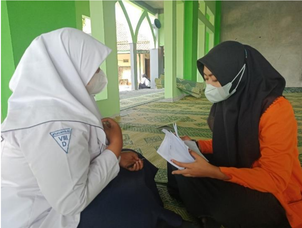
Gambar 1.5 wawancara dengan siswa kelas VIIID MTs Negeri 6 Boyolali