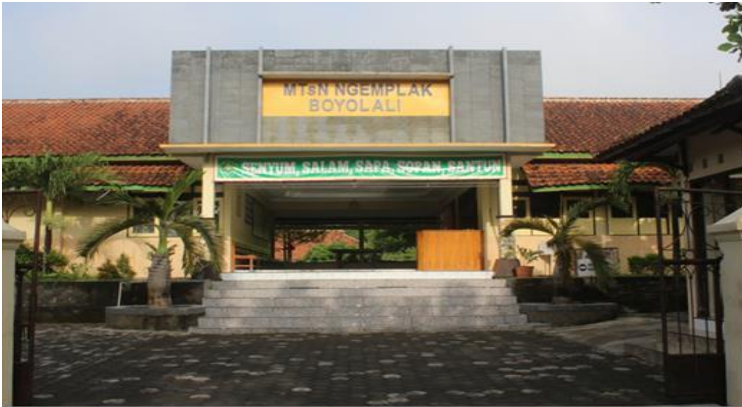
Gambar 1.1 Pintu Masuk Madrasah Tsanawiyah Negeri 6 Boyolali