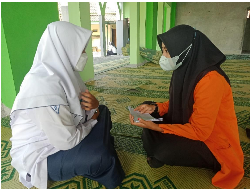
Gambar 1.3 wawancara dengan siswa kelas VIIID MTs Negeri 6 Boyolali