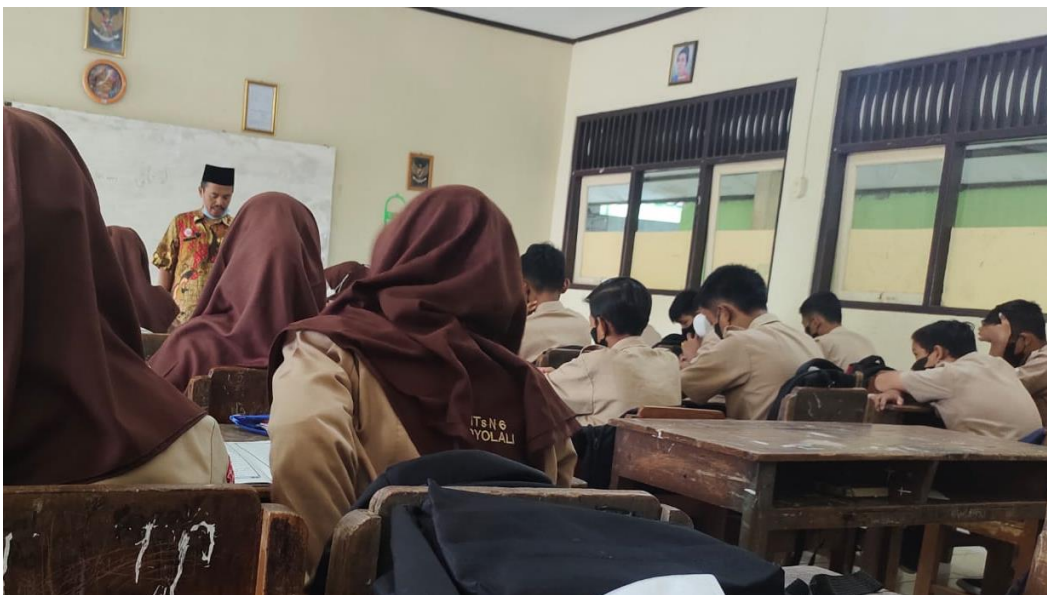
Gambar 1.6 pembelajaran siswa kelas VIIID MTs Negeri 6 Boyolali