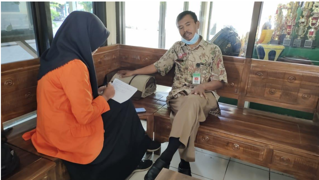
Gambar 1.2 Wawancara dengan Guru Bahasa a Arab kelas VIII