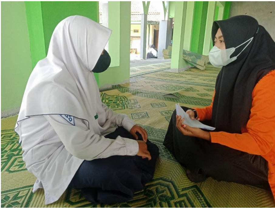
Gambar 1.4 wawancara dengan siswa kelas VIIID MTs Negeri 6 Boyolali